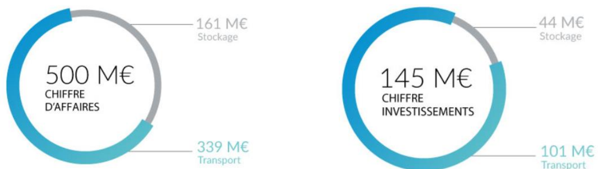
Figure 2: Chiffre d'affaires et investissements pour l'année 2019

Teréga est une société anonyme dont le capital s'élève à 17 579 088 €. En 2019, Teréga a réalisé un chiffre d'affaires d'environ 500 M€.