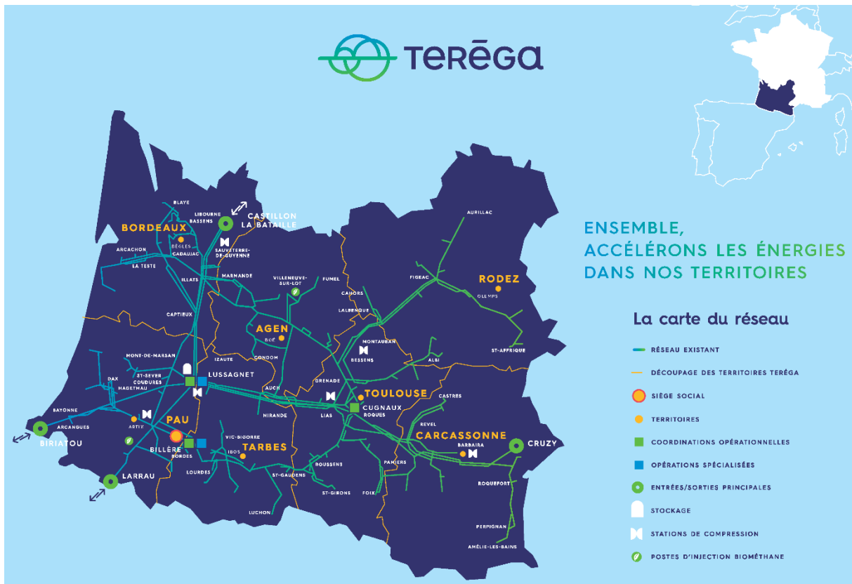
Figure 1 : Carte du réseau de Transport de Teréga